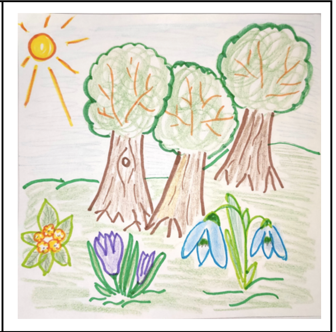
Frühlingsspaziergang im Wald: 2. Bilderset zur Geschichte