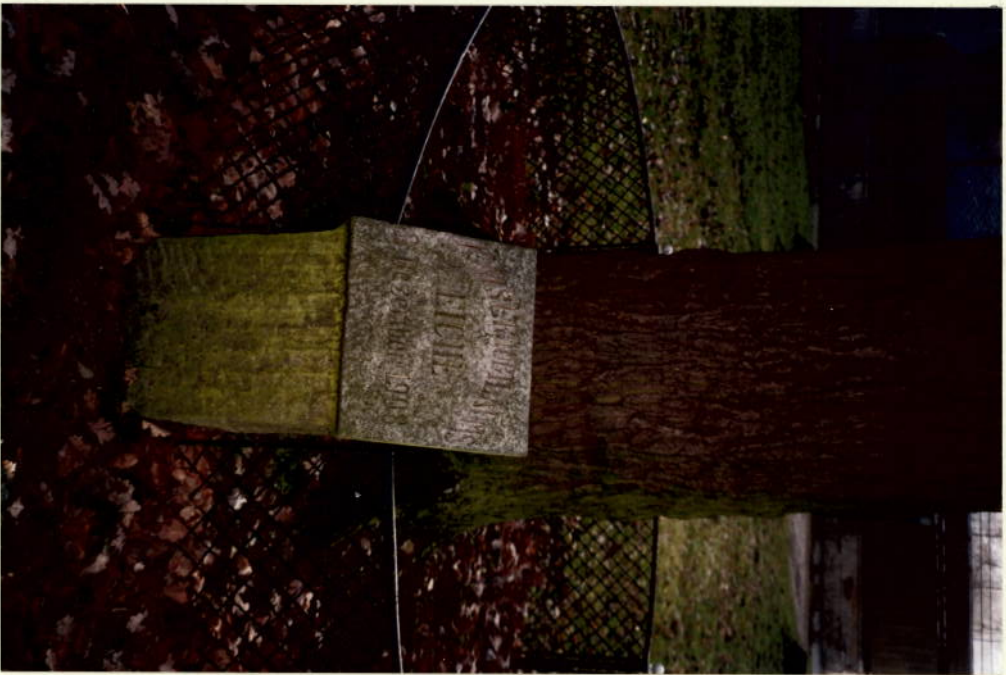
2012-94 V. 19.1.94 KÄISEDJURMIÄUMSGICHTS