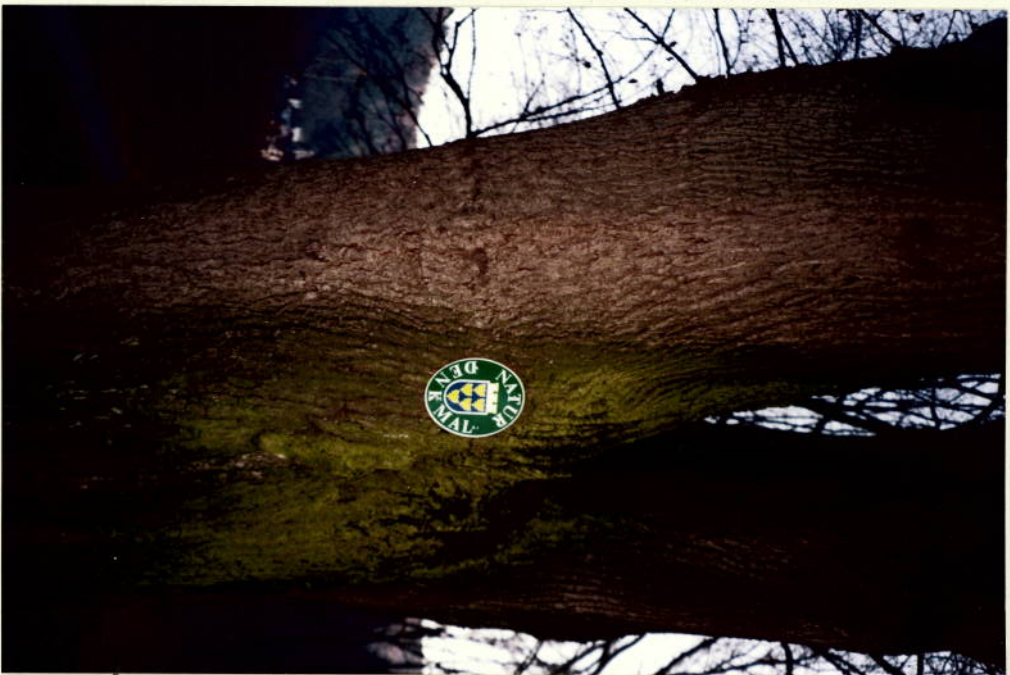
2212-94 V. 19.1.94 PAAVETIS KUF BAUMI B514 PÄÄPÄÄTSEINÄÄNÄ.