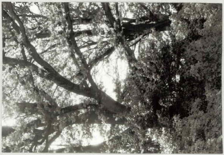
KRONENDETAIL VOM NÖRDLICHSTEN BAUM (STAMMUMFANG 3,15 m)